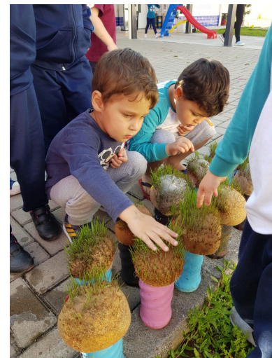
Imagem do Projeto Bonecos Ecológicos. Turma MB2