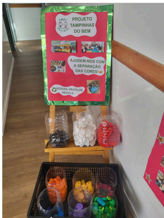
Captação das tampinhas.

NO INÍCIO DO ANO LETIVO FOI IMPLANTADO NA ESCOLA O PROJETO "TAMPINHAS DO BEM", COMO POLÍTICA DE BOAS PRÁTICAS VOLTADAS AOS CUIDADOS COM O MEIO AMBIENTE, E EM APOIO AS AÇÕES DESENVOLVIDAS PELO COLETIVO EDUCADOR MUNICIPAL. FUNCIONA DE FORMA MUITO SIMPLES: AS FAMÍLIAS SEPARAM AS TAMPINHAS EM SUAS CASAS; AS CRIANÇAS AS TRAZEM À ESCOLA, A ESCOLA REALIZA A SEPARAÇÃO POR CORES E ARMAZENA AS TAMPINHAS, ASSIM QUE JUNTAR UMA QUANTIDADE CONSIDERÁVEL, É REALIZADA A TROCA DAS TAMPINHAS POR BRINQUEDOS PLÁSTICOS PARA AS CRIANÇAS.