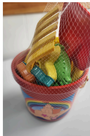
Pesagem das tampinhas e troca por brinquedos.