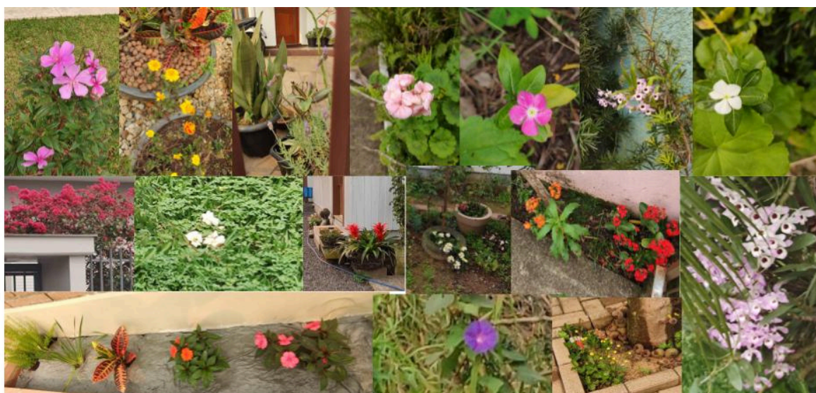
Plantas que representam a flora do bairro.

NO DIA 22 DE MAIO COMEMORAMOS O DIA INTERNACIONAL DA BIODIVERSIDADE. A DATA FOI INSTITUÍDA PELA ORGANIZAÇÃO DAS NAÇÕES UNIDAS (ONU) PARA CONSCIENTIZAR AS PESSOAS SOBRE A NECESSIDADE DE SE CONSERVAR E PROTEGER A DIVERSIDADE DE VIDA NO PLANETA. EM NOSSA ESCOLA, A TURMA DA CEI A, AS CRIANÇAS RECEBERAM INFORMAÇÕES SOBRE O QUE É A BIODIVERSIDADE E SUA IMPORTÂNCIA PARA O PLANETA. COMO PROPOSTA PEDAGÓGICA ÀS CRIANÇAS, FOI REALIZADO UM PASSEIO DE RECONHECIMENTO DAS PLANTAS E ANIMAIS QUE REPRESENTAM A FAUNA E A FLORA DO BAIRRO DA ESCOLA. SEGUEM IMAGENS DA FAUNA E FLORA ENCONTRADAS NO BAIRRO DA ESCOLA: